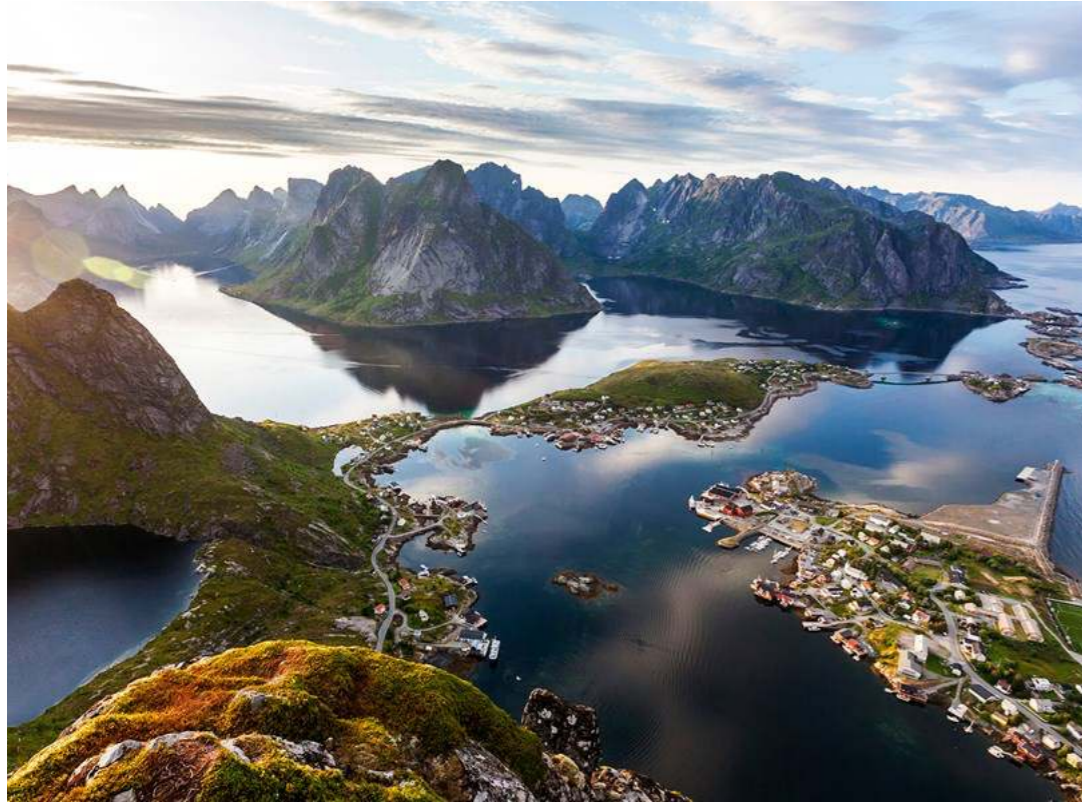
El pueblo de Reine