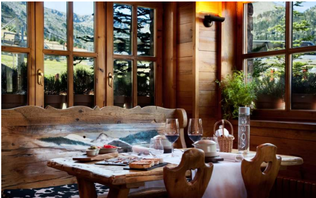
Restaurant Vaquería. Hôtel Grau Roig