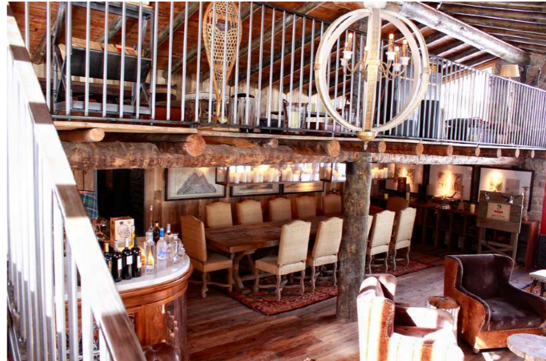
Intérieur du Vodka Bar

Les deux dîners montagne avec activités neige pour s'y rendre se feront en fonction du nombre de personnes du groupe car il y a un minimum de personnes nécessaire pour effectuer la réservation dans certains d'entre eux.