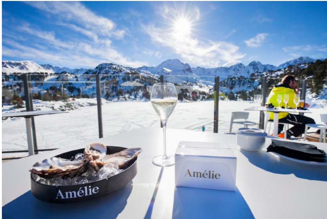
Terrasse du Restaurant Pessons à Grandvalira