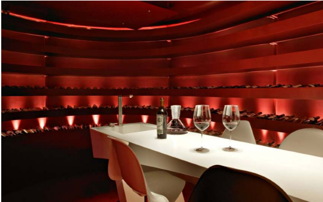
Teatro del Vino. Hôtel Grau Roig