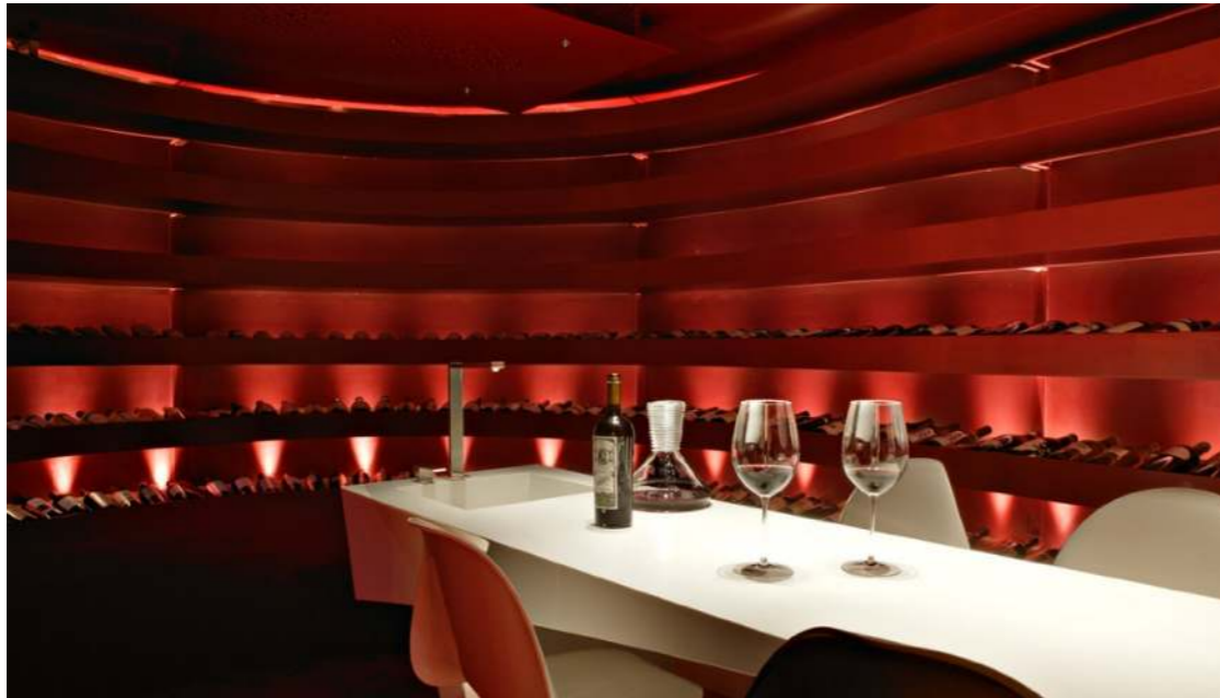
Teatro del Vino. Hôtel Boutique Grau Roig