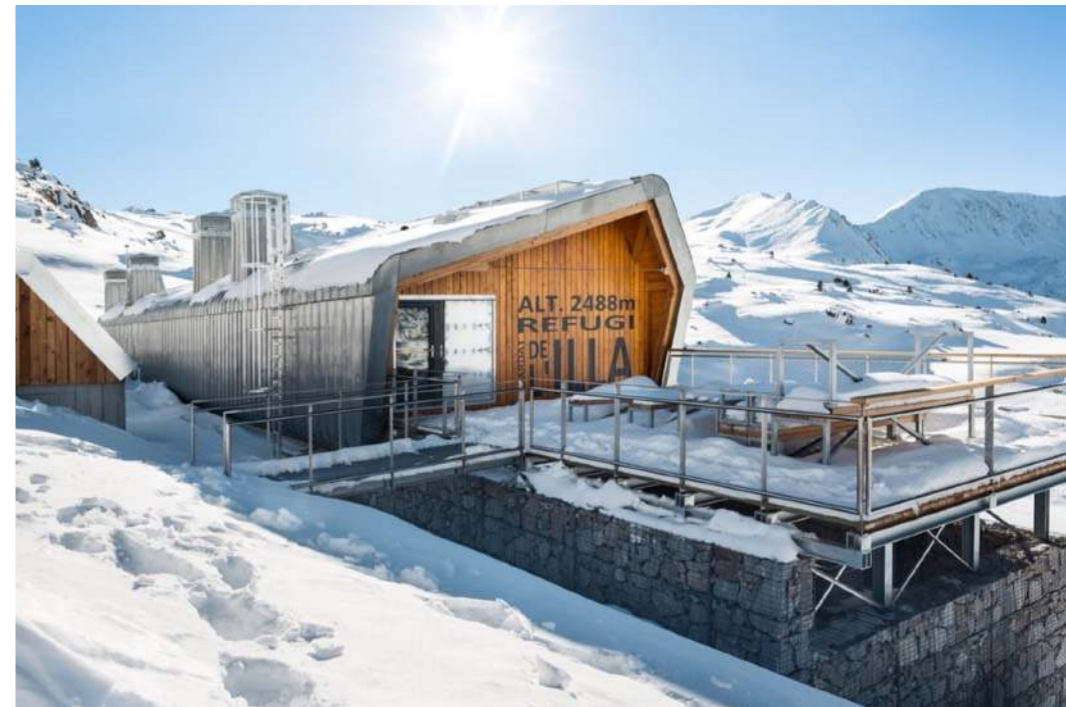
Refugio de L'Illa

Vous aimez le concept? Vous avez simplement à faire la demande lorsque vous effectuez la réservation. Nous nous adapterons en conséquence et nous vous concocterons sur mesure votre séjour de ski de randonnée.