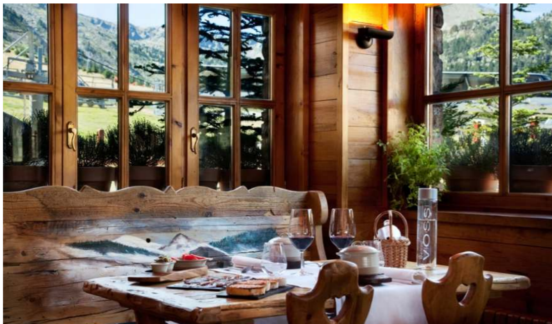
Restaurant Vaqueria. Hôtel Boutique Grau Roig